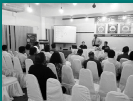
• Educating customers on new products