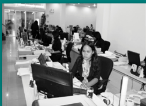
• Customer Care service that our competitors and business associates speaks about