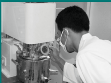
• Innovation of product